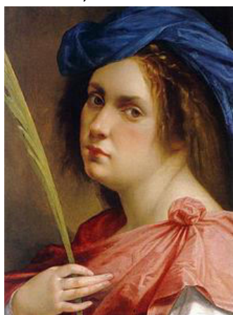
Figura straordinaria di donna e artista, vera antesignana dell'affermazione del talento femminile, Artemisia Gentileschi sarà in mostra a Palazzo Braschi, e Nuova Acànto non poteva certo non includere una visita guidata a questa mostra (il 12 Aprile).

L'uomo in quanto essere "sociale" ha sempre avuto bisogno di comunicare. Dalle incisioni rupestri ai geroglifici, dai papiri alle pergamene e alla carta e poi con lo sviluppo dei sistemi postali fino alla posta elettronica e oltre, si può compiere un affascinante viaggio della storia dell'umanità, descrivendo piccoli episodi e grandi eventi con il supporto di lettere, documenti postali, fotografie. Sarà il tema di una conferenza nella nostra sede, venerdì 7, alle 15:30.